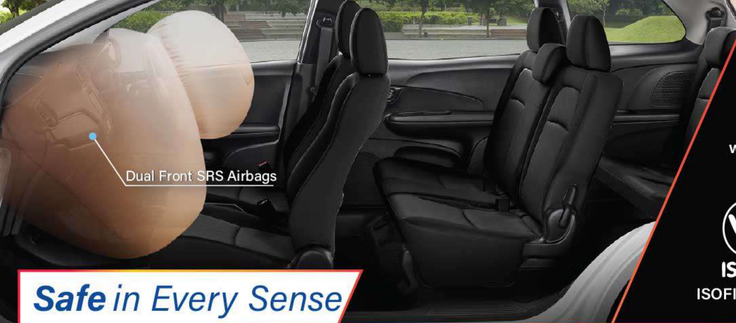
Dual Front SRS Airbags