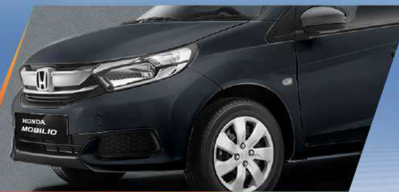
Meteoroid Gray Metallic